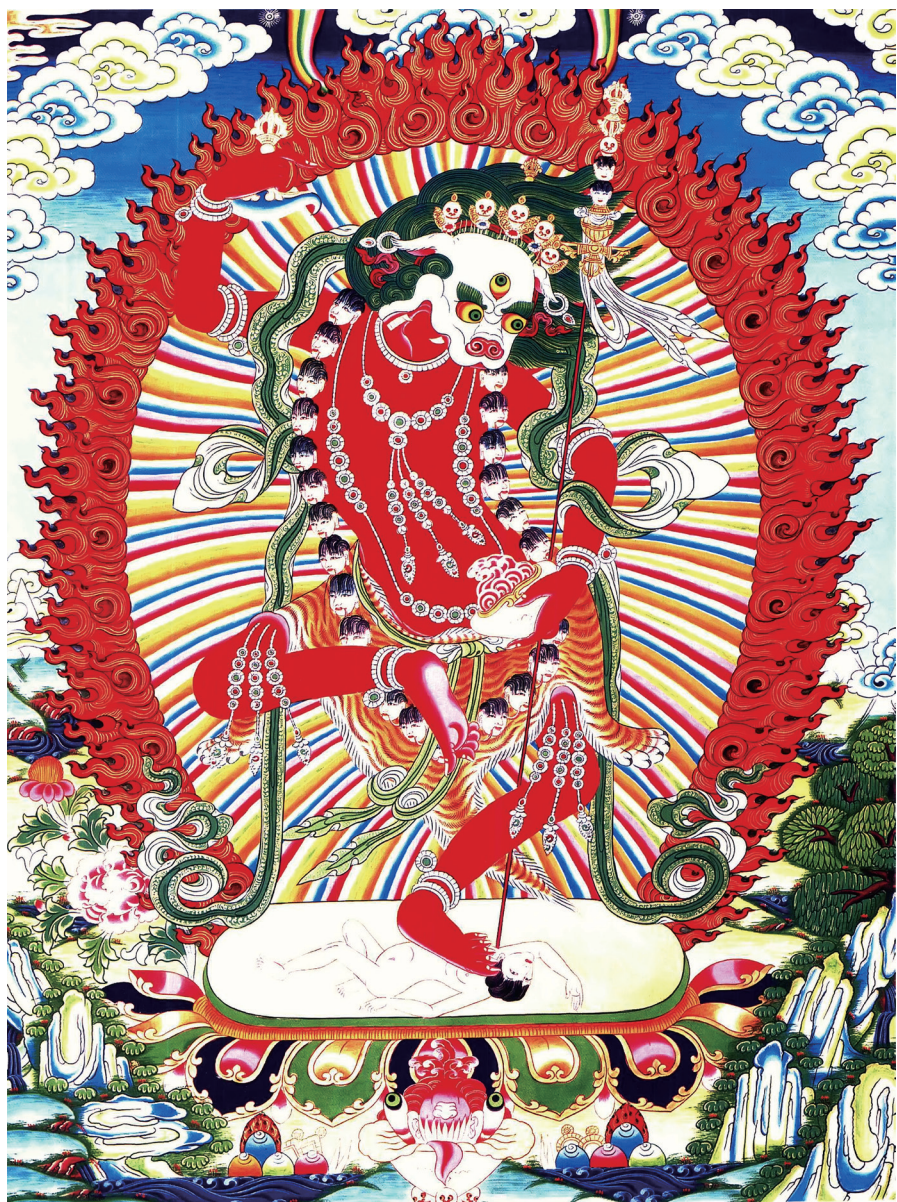
སེང་གཞོང་མ་ལ་ན་མོ། 南无狮面佛母