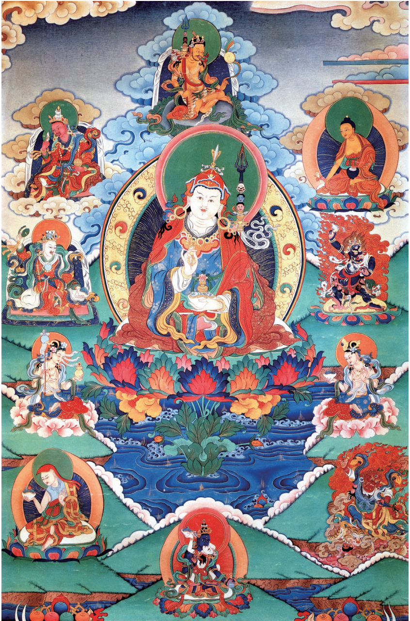
གུ་རུ་རིན་པོ་ཆེ་ལ་ན་མོ། 南无莲花生大士