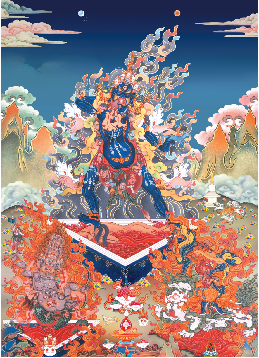
ཚོས་སྟོང་གསུམ་མགོན་ལ་ན་མོ། 南无护法三怙主