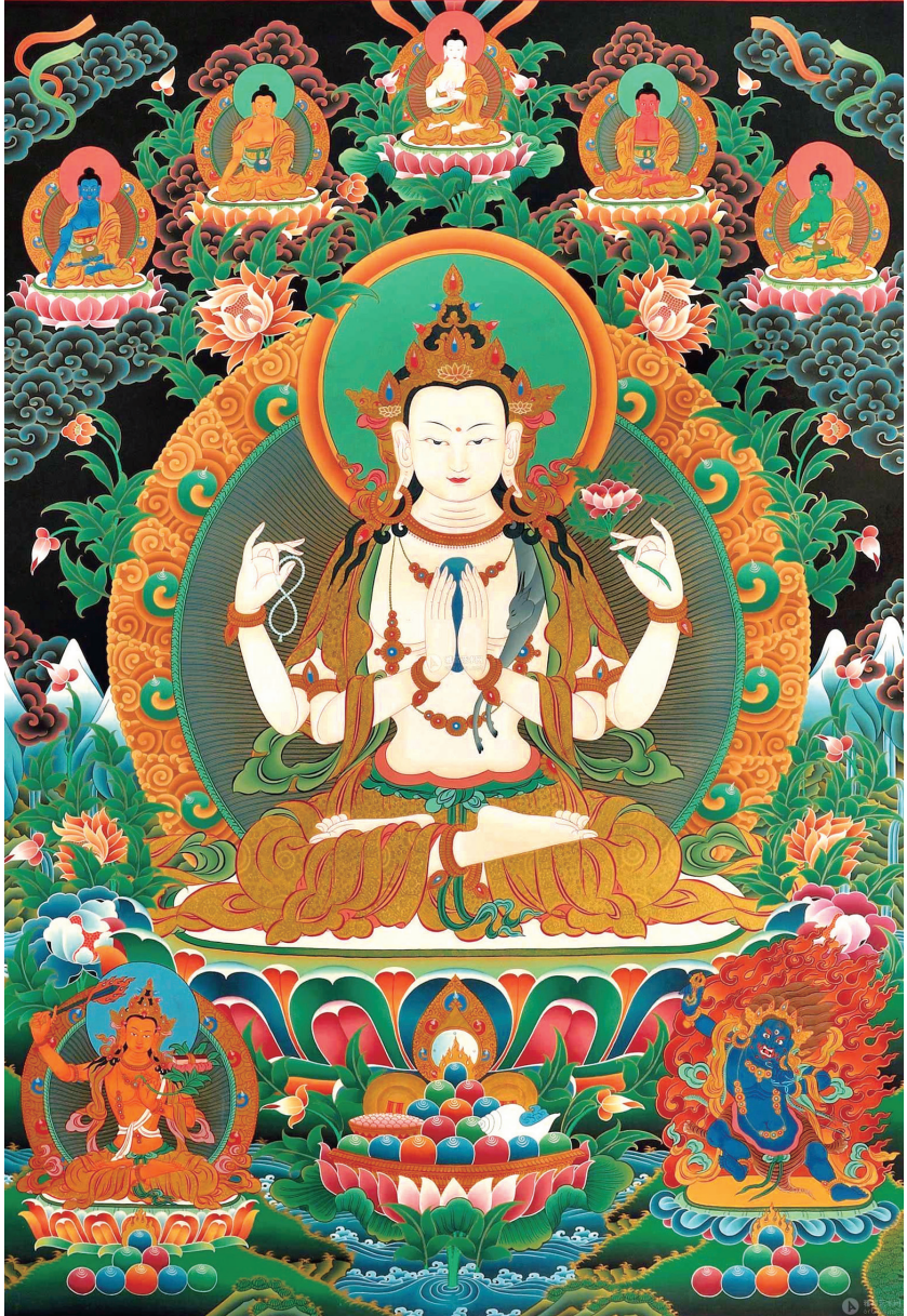
འཇགས་པ་སྤྱན་རས་གཟིགས་ལ་ན་མོ། 南无观音菩萨