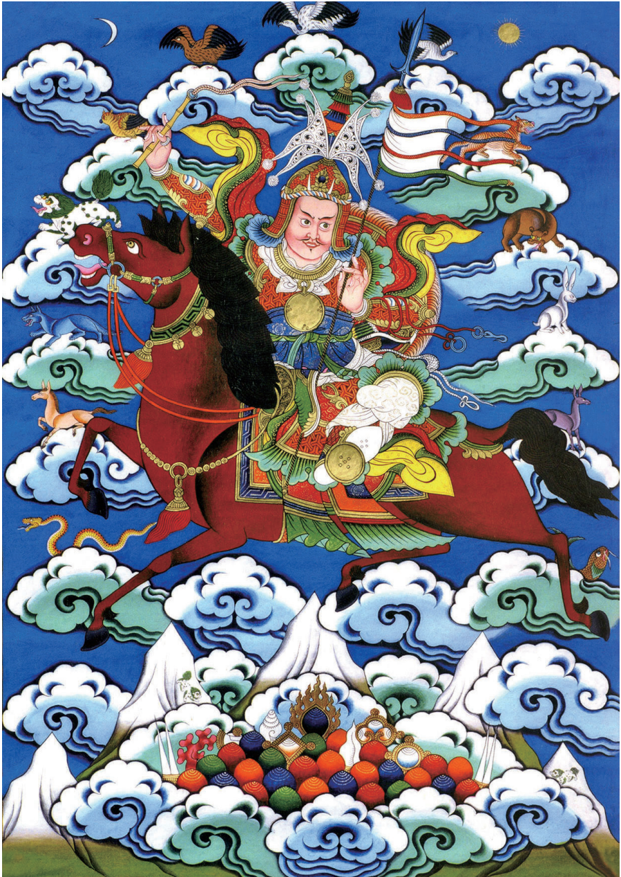
གཤམ་རྒྱལ་པོ་ལ་ན་མོ། 南无格萨尔王