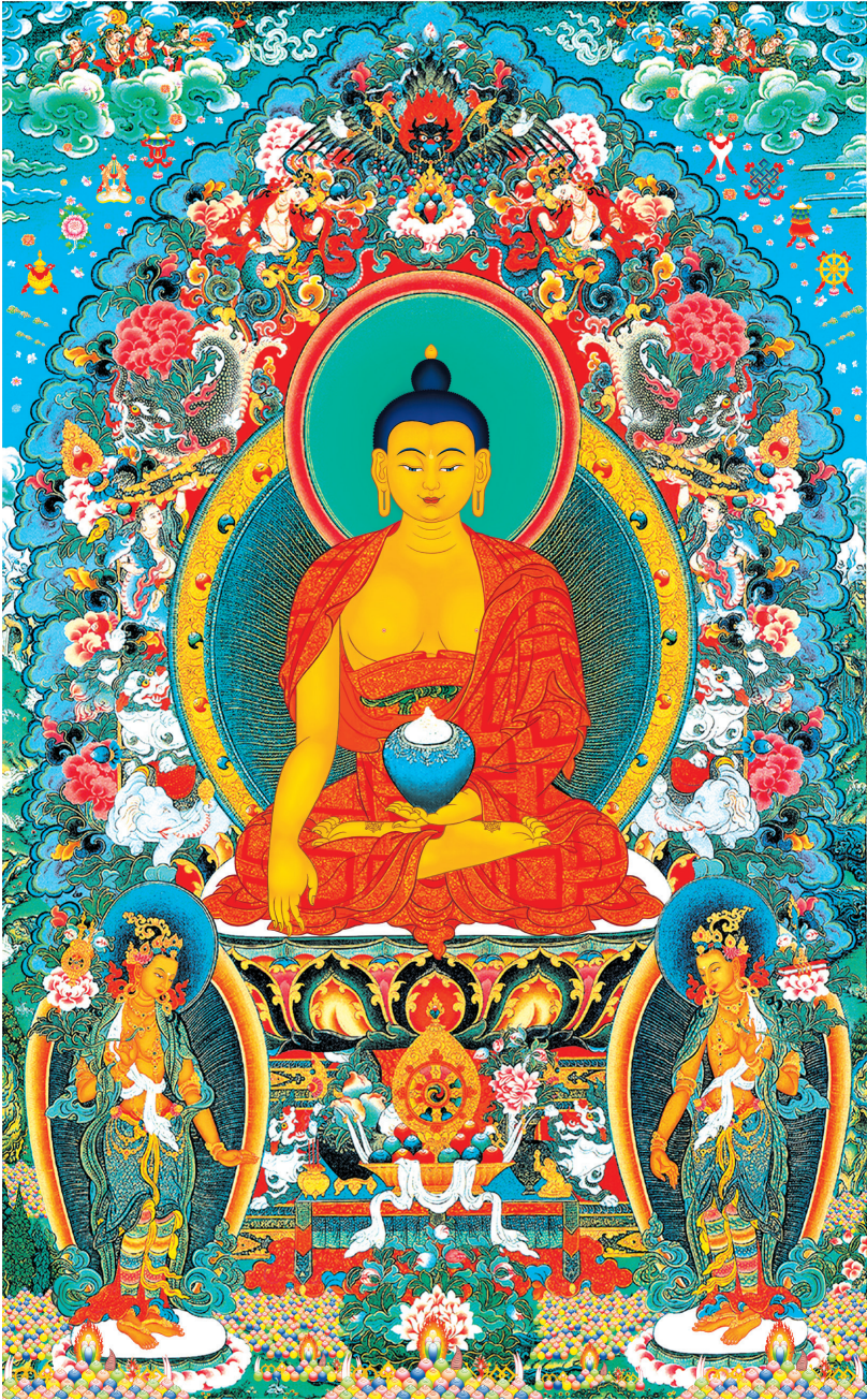
སངས་རྒྱལ་ལྷན་ལྷན་སྐྱེས་པ་ལ་ན་མོ། 南无释迦牟尼佛