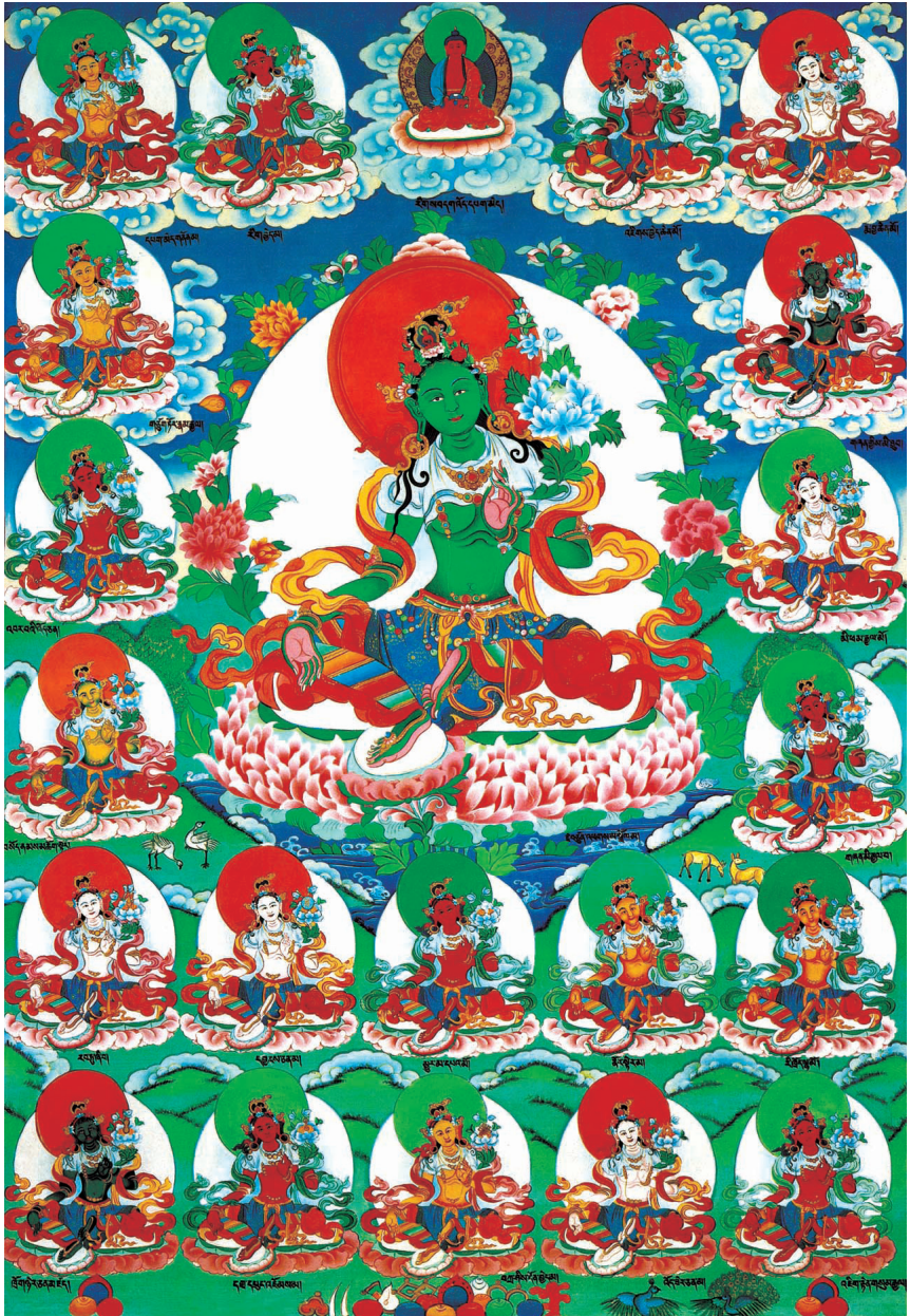
འདམག་ས་མ་སྟོལ་མ་ཉེར་གཅིག་ལ་ན་མོ། 南无二十一度母