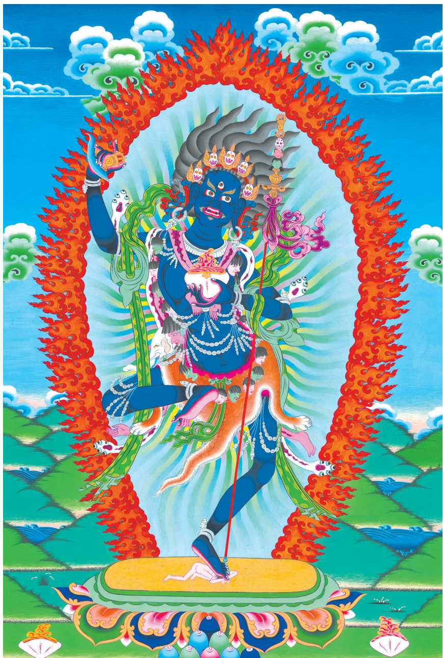
དེེ་ཁོ་མོ་ལ་ན་མོ། 南无金刚忿怒母