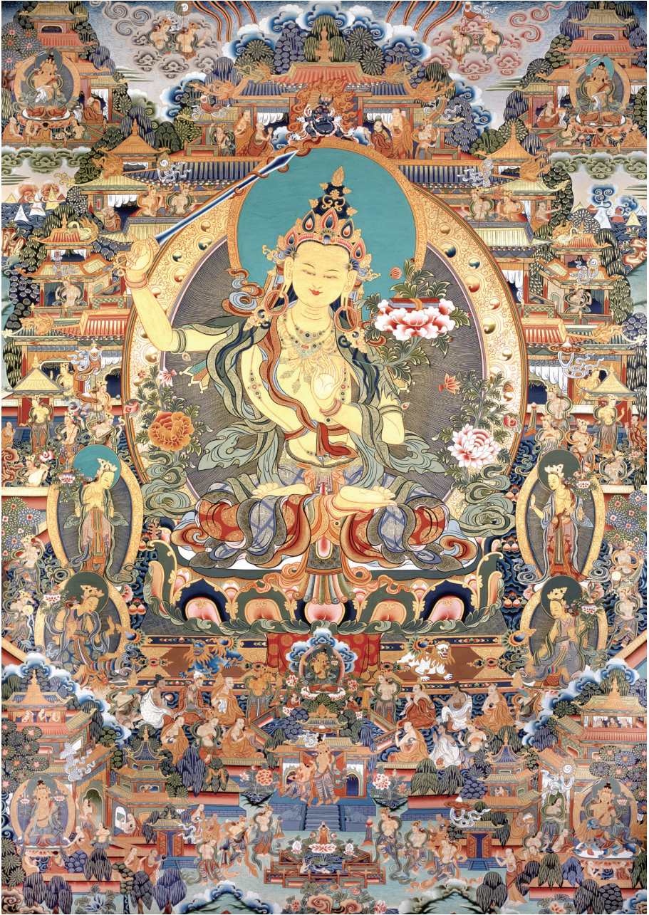
འཕགས་པ་འཇམ་དཔལ་དབྱངས་ལ་ན་མོ། 南无文殊菩萨