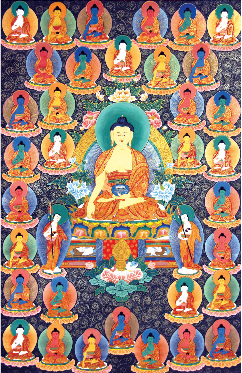
སངས་རྒྱས་སོ་ལྔ་ལ་ན་མོ། 南无三十五佛