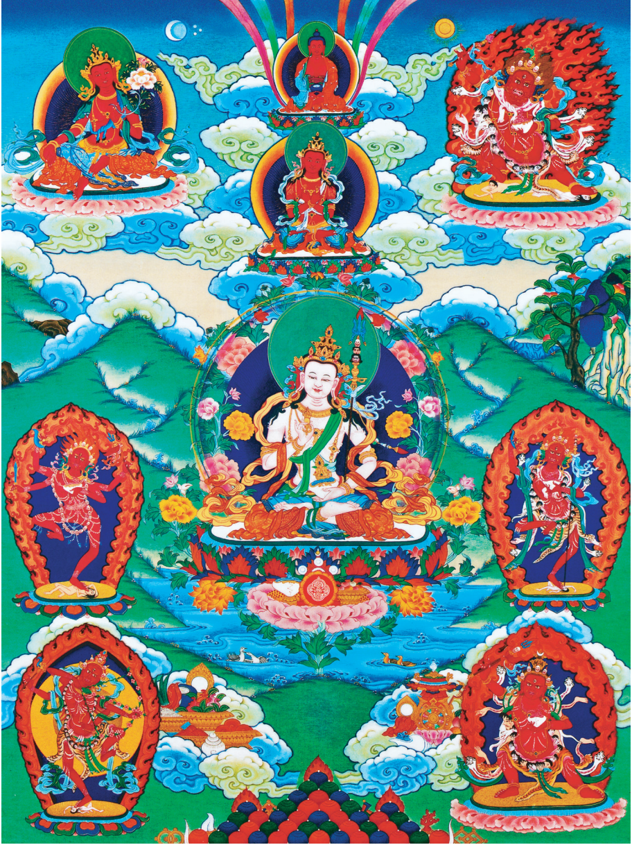
གར་དབང་ལྷ་དགུ་ལ་ན་མོ། 南无怀业九本尊