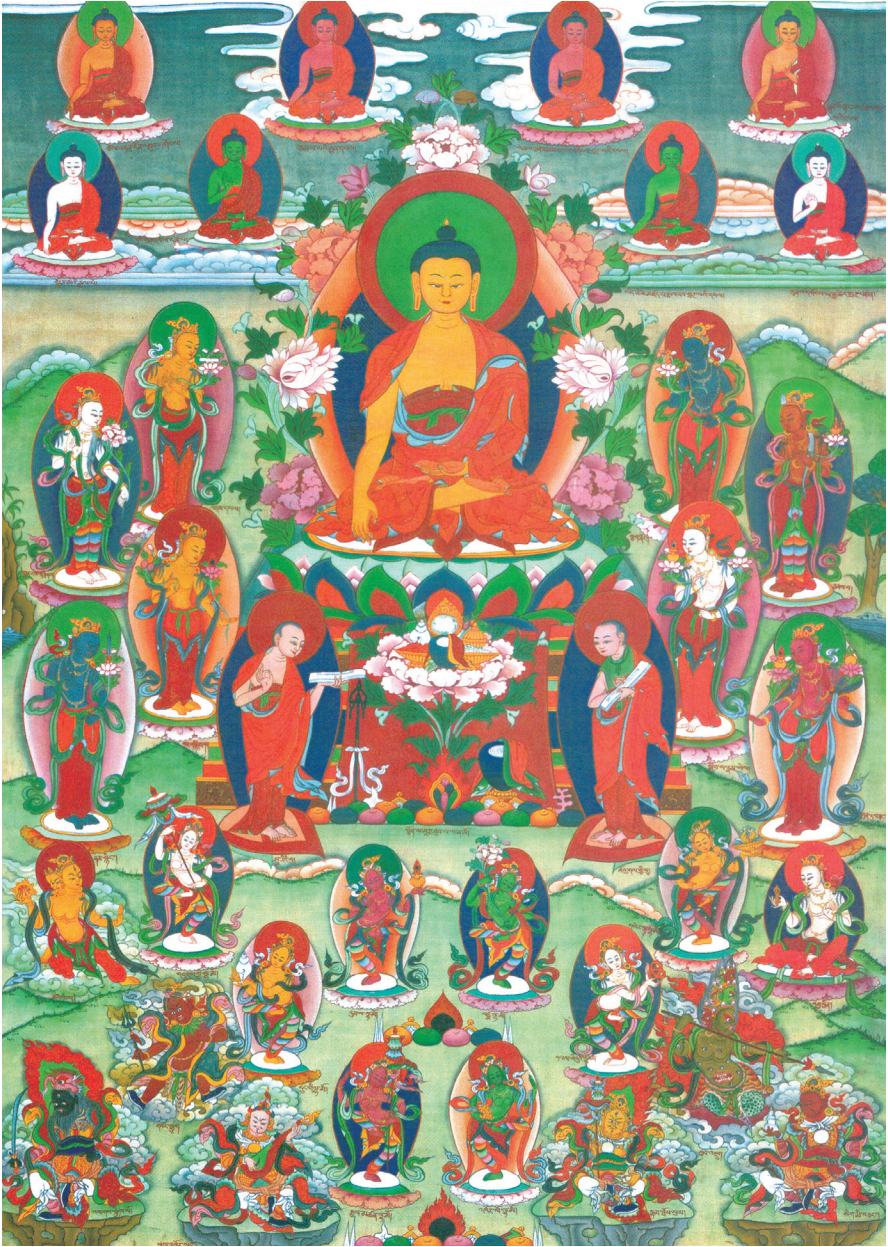
བཟང་ལེས་བརྒྱད་པའི་ཚོགས་ཞིང་། 圣八吉祥