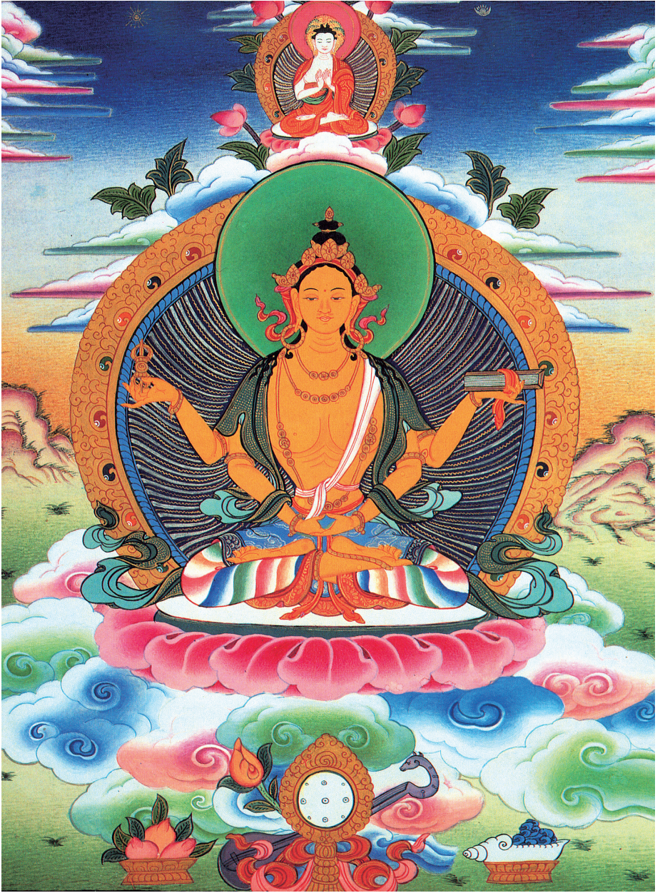
ཚོས་སྐུ་ཡུམ་ཆེན་མོ་ལ་ན་མོ། 南无般若佛母