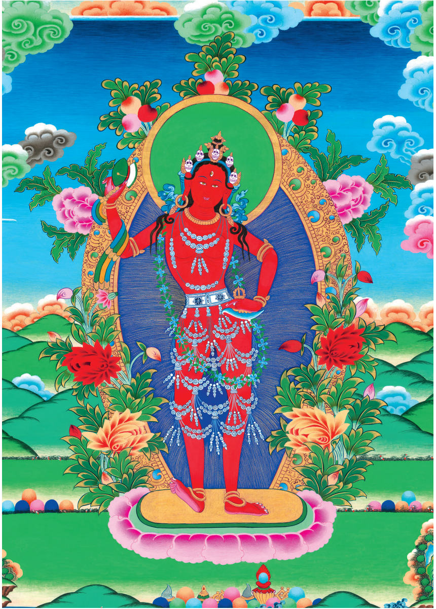
དོ་ཇི་ནལ་འབྱུང་མ་ལ་ན་མོ། 南无金刚瑜伽母