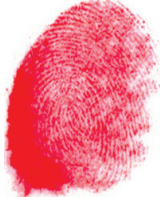
ཧྲོ་ཚོས་ཇི་ཡིད་བཞིན་ཅོར་བུའི་བྱག་ཐེལ། 法王如意宝晋美彭措手印